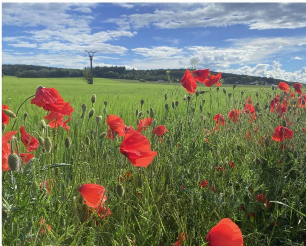
1. místo ve fotosoutěži - kategorie dospělí, Autor : Lucie Školudová