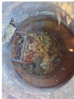
tuky v kanalizaci

Nejen, že se ucpává potrubí, ale velké kusy ztvrdlého tuku často doputují na již tak přetíženou ČOV nebo způsobují problémy na přečerpávací stanici na návsi. Asi Vás nepřekvapí, že ani ta není v dobrém stavu. Tady bude v nejbližších dnech zapotřebí celková rekonstrukce. Cenový odhad je kolem 1 milionu korun.